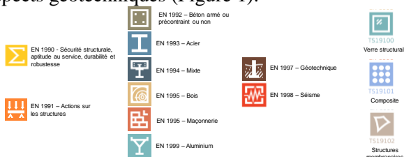
Figure 1. Vue d'ensemble des différents Eurocodes

L'Eurocode 7 (EN 1997), relatif au dimensionnement des ouvrages géotechniques, s'appuie sur l'Eurocode 0 (EN 1990), pour les principes de dimensionnement et sur l'Eurocode 1 (EN 1991) pour la définitions des actions, avec l'introduction par exemple de modèle de charge routière spécifiques aux applications géotechniques. L'Eurocode 7 se réfère également aux Eurocodes traitant des vérifications structurales pour les constructions en béton (EN 1992), acier (EN 1993), mixte béton-acier (EN 1994) bois (EN 1995) ou maçonnerie (EN 1996). A l'avenir, ces Eurocodes « matériaux » pourront être complétés de spécifications techniques sur les règles de conception des composants en verre (TS 19100), sur le calcul des structures en matériaux composites (TS 19101) ou sur les structures en membrane tendue (TS 19102). L'Eurocode 8 (EN 1998) concerne quant à lui les dimensionnements sous séismes y compris sur les aspects géotechniques (Figure 1).